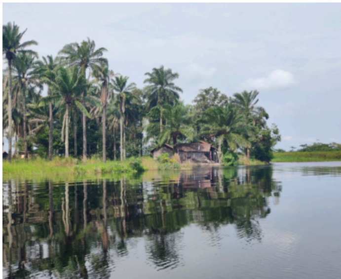
Un village paisible au bord de la rivière Alima

Enfin, depuis 2005, le Gabon et la République du Congo ont mis en place le programme de surveillance « One Health » , auquel nos guides sont formés, qui suit de près la faune sauvage pour détecter le moindre signal inhabituel bien à l'avance. Grâce à ce dispositif, ces pays n'ont connu aucune épidémie d'Ebola depuis 2005.